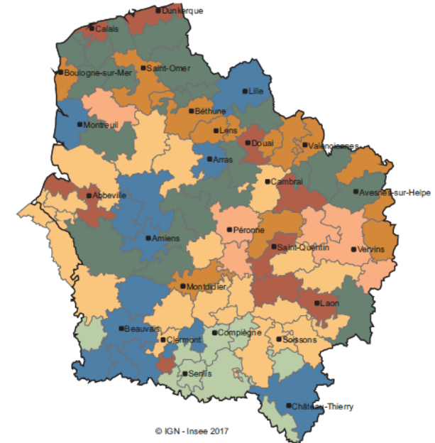
Profil des territoires selon leurs trajectoires sociales